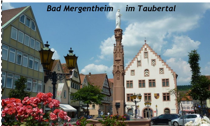
Bad Mergentheim im Taubertal

Die letzte Fahrt in diesem Jahr geht am 10. Dezember nach Dortmund zum Weihnachtsmarkt. Über 300 Stände bieten handwerkliche Kostbarkeiten, himmlische Geschenkideen und weihnachtliche Schätze auf einem der schönsten Weihnachtsmärkte Deutschlands. Abfahrt: 8 Uhr Kevelaer, 8.20 Uhr Geldern, 08.30 Uhr Issum. Eine frühzeitige Anmeldung für diese Fahrt im Kneipp-Büro für 24 Euro ist empfehlenswert.